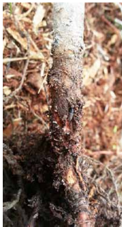
Obrázok 4 Lykokaz sadenicový pri zrelostnom žere

Lykokaz sadenicový vyhlodáva svoje materské chodby v druhej polovici mája a začiatkom júna pod kôrou pňov čerstvo zoťatých smrekov alebo pod hladkou nešupinatou kôrou smrekových kmeňov ležiacich na zemi. Vývoj potomstva sa čiastočne končí ešte v jeseni. Larvy a kukly čiastočne prezimujú a nové imága sa liahnu až v lete budúceho roka. Vyliahnuté chrobáky sa hneď zavrtávajú do koreňov čerstvo vysadených i starších sadenic v kultúrach a vyzierajú na nich kanálikovité chodbičky v kôre a lyku. Ide o zrelostný žer. Pri tomto žere chrobák prezimuje a na jar ďalšieho roka – koncom apríla, začiatkom mája – nalietava na miesta vhodné na jeho ďalšie rozmnožovanie. Lykokaz pňový má podobnú bionómiu, ale škodí prevažne na borovici.