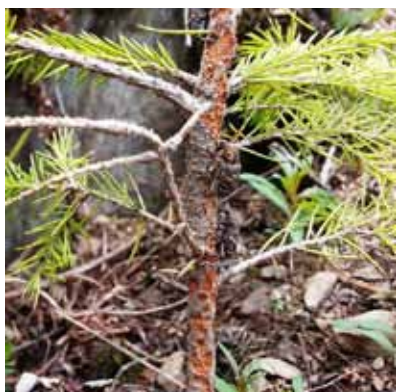
Obrázok 1 Tvrdoň smrekový pri zrelostnom žere

Kuklia sa v lôžku vyhlodanom do dreva. Larvy väčšinou prezimujú. Nové chrobáky sa liahnu podľa podmienok na jar budúceho roka, v priebehu roka alebo až v ďalšom roku. Dĺžka celého vývoja výrazne závisí od teploty, môže trvať od 4 mesiacov až viac ako 2 roky. Najväčšie škody spôsobuje imágo tvrdoňa v ihličnatých kultúrach vysadených na čerstvých rúbaniskách, kde ho láka vôňa živice z čerstvých pňov, v ktorých sa vyvíja larva. Dospelý tvrdoň môže v ideálnych podmienkach žiť až 4 roky! To znamená, že škody na sadenicach sa môžu vyskytovať na výsadbe ešte v 5. roku po vykonaní poslednej ťažby v blízkosti mladého porastu.