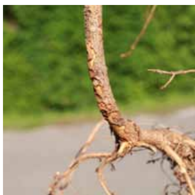
Obrázok 2, 3 Poškodenie sadeníc smreka na koreňovom krčku a kmieni tvrdoňom smrekovým