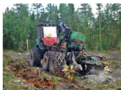
Obrázok 11 Skarifikácia – zraňovanie pôdy

Skarifikácia (zraňovanie) pôdy – je to vytváranie rýh adaptérom na zraňovanie pôdy neseným za traktorom (obr. 11). Humusová vrstva pôdy sa naruší až po minerálnu vrstvu. Do takto pripravenej ryhy sa sadia sadenice. Opäť tu platí, že sadenice vysadené do minerálnej pôdy sú štatisticky výrazne menej poškodzované tvrdoňmi ako sadenice sadené do humusovej vrstvy. Metódu je možné použiť len v dostupných terénoch.