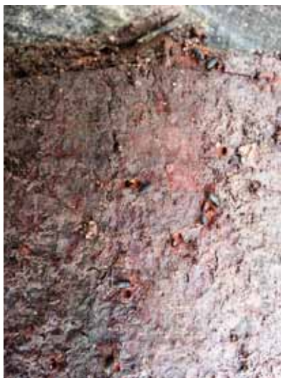
Obrázok 9 Lykokozy rodu Hylastes na spodnej strane lapacej kôry

30 lykokazov na kôru), kôry zobrat na bezpečné miesto a spáliť.