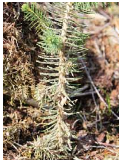
Obrázok 10 Pieskom ošetrená sadenica – metóda Conniflex

Pieskovanie sadeníc – metóda sa nazýva Conniflex ( www.conniflex.se ). Metóda bola vyvinutá vďaka výskumným pracovníkom z SLU (Swedish University of Agricultural Sciences) vo Švédsku (Uppsala) pred pár rokmi. Myšlienka na ošetrenie sadeníc práve pieskom vznikla pomerne náhodne, keď výskumní pracovníci boli v „teréne“ a pravidelne hodnotili poškodenie sadeníc svojich pokusov. Zistili, že po daždi, nakoľko je tam miestami podobná piesková pôda ako na Záhorí, sadenice, na ktorých bol prichytený piesok, boli omnoho menej poškodené od tvrdoňa ako sadenice, na ktorých tento piesok nebol. Tak vznikla myšlienka mechanickej ochrany sadeníc nanesením vrstvy piesku na kmienok sadenice (obr. 10).