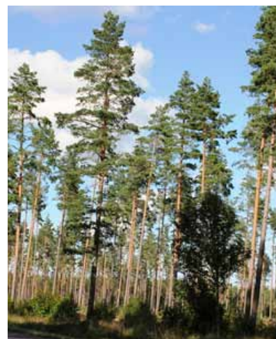
Obrázok 12 Materský porast vytvára dostatočnú zásobu potravy na to, aby zmladenie a výsadby neboli pod takým silným tlakom – Shelter trees

Metóda tzv. „Shelter trees“ alebo vysádzanie pod materský porast – metóda sa často používa vo Švédsku, kde sa dospelý porast nezrúbe celkom, ale ponechá sa na ploche 100 – 150 stromov na ha (obr. 12). Následne vysádzané sadenice pod materský porast sú výrazne menej poškodzované ako na voľnej ploche, pritom sa zistilo, že populačná hustota škodcu je na voľnej ploche a pod materským porastom takmer rovnaká. Nižšie poškodenie je tu hlavne z toho dôvodu, že tvrdone tu majú omnoho vyššiu potravnú ponuku (korene a koruny materských stromov ap.). Slovo shelter mimo iného znamená tiež úkryt, čiže sadenice pod takýmto porastom sú taktiež chránené voči mrazu, priamemu slnku, prísušku, suchu a majú tu menší stres z presadenia, čím odrastajú rýchlejšie.