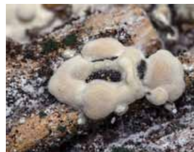
Obrázok 14 Tvrdoň smrekový prerastený entomopatogénnou hubou Beauveria bassiana

odparníky, ktoré by úspešne lákali tvrdone sú v štádiu vývoja. Kolektív pracovníkov LOS sa podieľa na niektorých terénnych testoch ich účinnosti. Niektorí vedci sa domnievajú, že tvrdone neprodukuje tzv. „long distance“ feromóny, ktoré by sa dali synteticky vyrobiť, ale je treba sa zamerať cestou vývoja primárnych atraktantov (terpény, etanol ap.). Antifeedants sú látky, ktoré odpudzujú tvrdone. Sú skúmané najmä vo Švédsku.