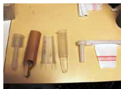
Obrázok 13 Rôzne typy ochranných golierikov sadeníc

Ochranné golieriky – je to spôsob individuálnej ochrany sadeníc. Princípom je zabránenie prístupu tvrdoňa k sadenici. Existovalo viacero druhov používaných najmä v Škandinávií (obr. 13). Niektoré typy sa stali obľúbenou hračkou pre vtá-