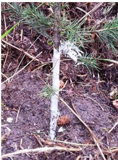
Obrázok 6 Správne zasadená navoskovaná sadenica

Jednou z najčastejšie používaných metód ochrany, najmä v oblastiach, kde nebola povolená výnimka na použitie pesticídov, je využitie čerstvých smrekových lapacích kôr navnadенých smrekovým alebo borovicovým výhonkom, resp. vetvičkou.