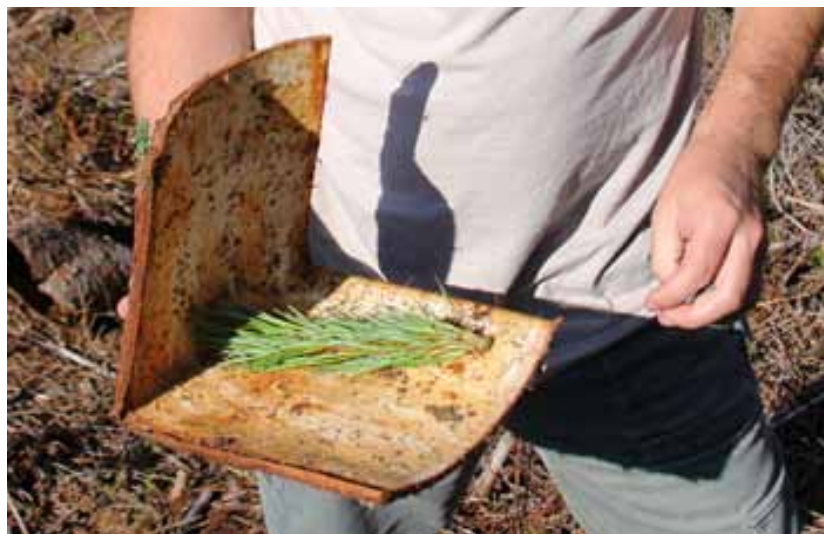
Obrázok 7 Preložená lapacia kôra na tvrdoňa smrekového