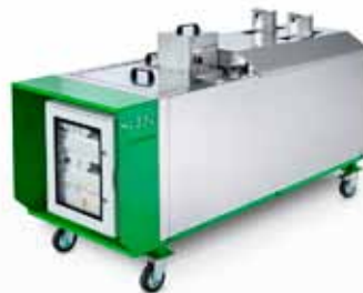
Obrázok 5. Voskovací stroj „Double fountain machine“

Double fountain machine alebo dvojité fontánová mašina (obr. 5) prešla za posledné roky taktiež výrazným vývojom. Prvou verziou fontánovej mašiny, ktorá vznikla v 90. rokoch 20. storočia (je stále funkčná!), bol len jednoduchý „kotel“, resp. otvorená nádoba s dvojitým plášťom. Do kotla sa vkladajú stuhnuté tabule špeciálneho vosku s rozmermi 50 × 50 × 5 cm (čo je cca 5 kg). V medziplášti sa nachádzajú elektrické špirály, ktoré roztopia tabule vosku. Po rozpustení vosku